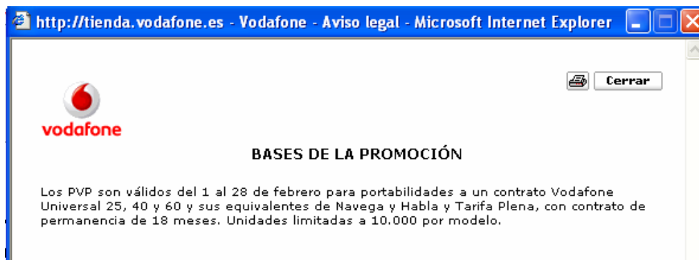
Ilustración nº 4

b) Ventas con obsequios. Reguladas en los artículos 32 y siguientes de la LOCM. Establece el artículo 32.1 LOCM que “con la finalidad de promover las ventas, podrá ofertarse a los compradores otro producto o servicio gratuito o a precio especialmente reducido, ya sea de forma automática, o bien, mediante la participación en un sorteo o concurso”