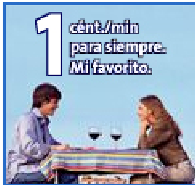
Ilustración nº 2