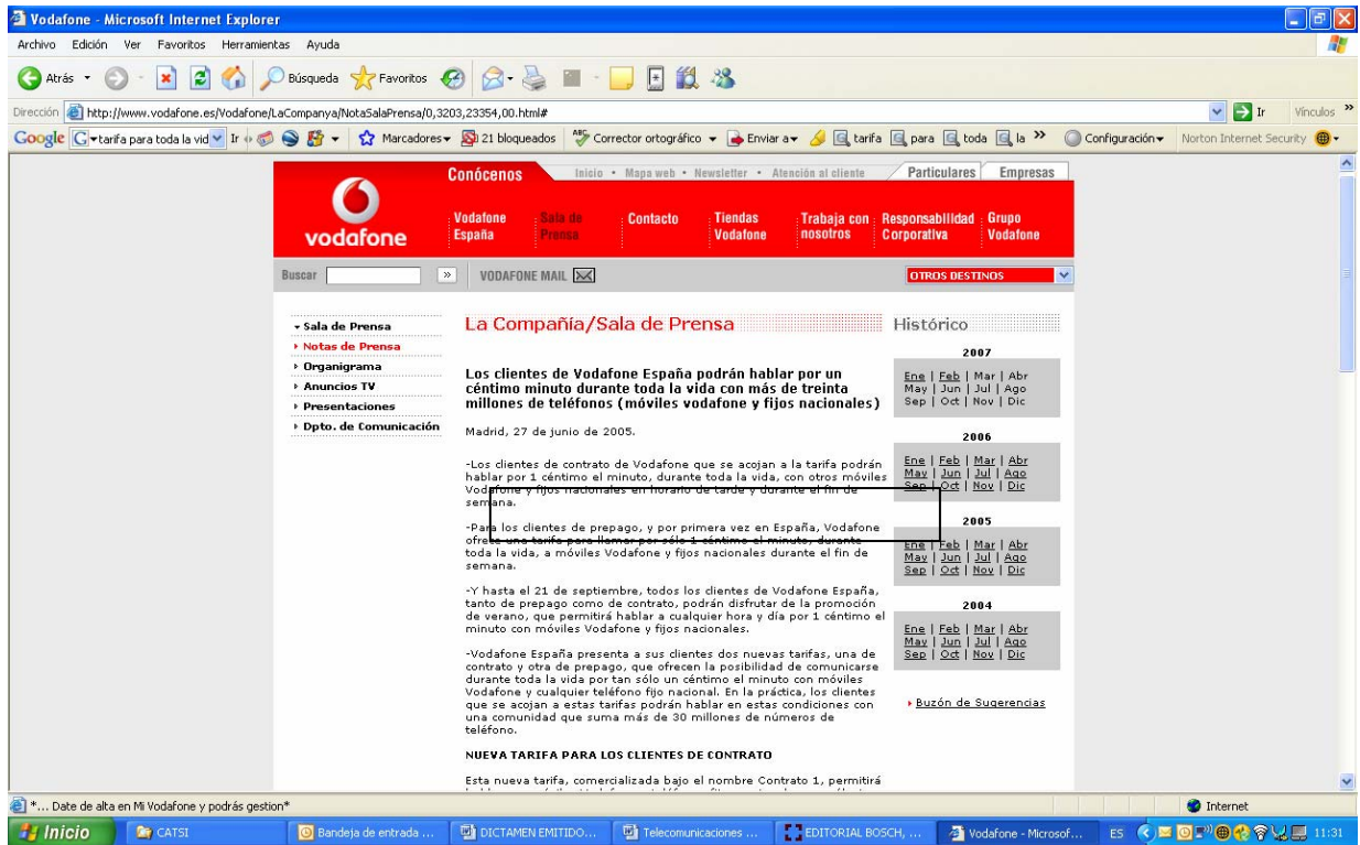
Ilustración nº 1